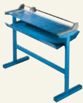
Adicional opciones 00696 Bastidor inferior