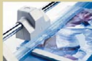
Prensado automático en el punto de corte