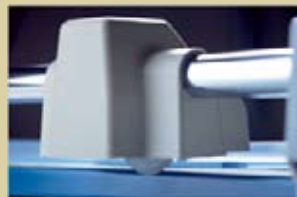
Cabezal de corte