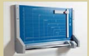
Cizalla montada en la pared