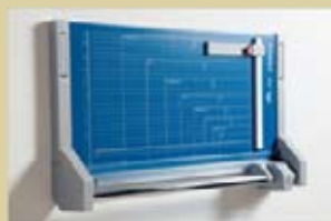
Cizalla montada en la pared