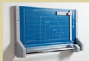
Cizalla montada en la pared