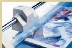
Prensado automático en el punto de corte