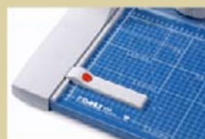
Tope posterior variable