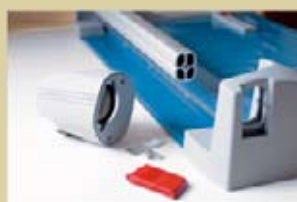
Cambio de cuchilla sencillo