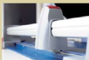
Cuchilla circular con cabezal de plástico