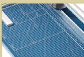
Líneas de orientación